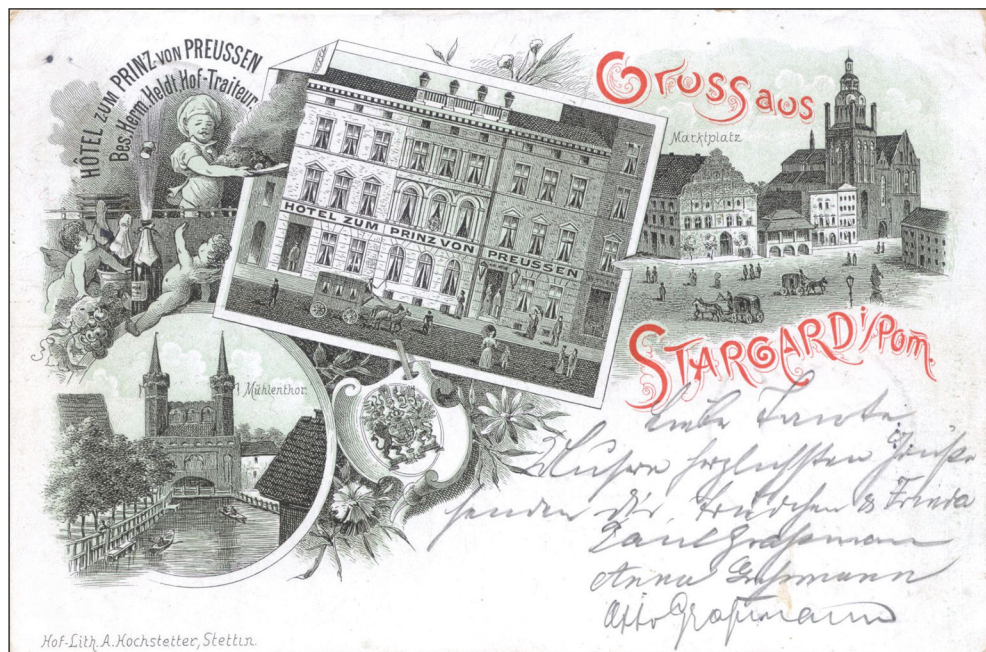
Ryc. 1. Pocztówka litograficzna przedstawiająca kamienice przy Poststrasse 4–5 (obecnie ul. Grodzka), w których mieścił się hotel zum Prinz von Preussen, 1898 r.