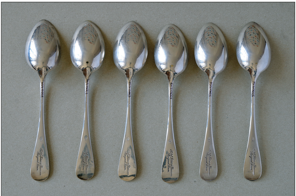
Ryc. 5. Rewers łyżek stołowych.