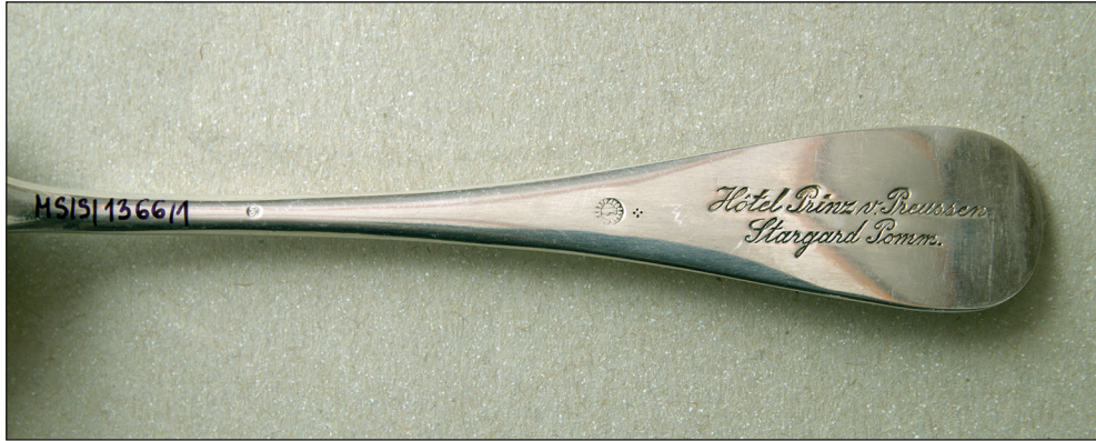
Ryc. 6. Zbliżenie na znaki znajdujące się na odwrocie jednej z łyżek.

ściciel do ok. 1907 r.) oraz rodzina Gross (właściciel do ok. 1924 r.). W kolejnych latach gospodarze zmieniali się o wiele częściej. W latach 30. XX w. obiekt przeszedł całkowitą renowację 13 . Cały czas natomiast nie zmieniała się jego nazwa.