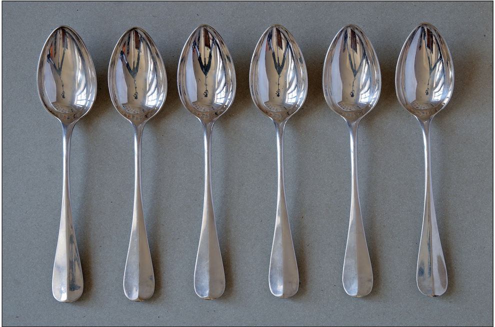
Ryc. 4. Łyżki stołowe w komplecie.